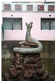
Ust' Čorna - socha hada v centru obce

Povodně v údolí Ust' Čorné bohužel nebývají vzácností. Spekuluje se, že jejich příčinou může být přehnaná těžba dřeva ve zdejších lesích. V poslední době nejničivější proběhla na podzim 1998. Povodní bylo v Ruské a Německé Mokré a v Lopuchivu zničeno přes 40 domů.